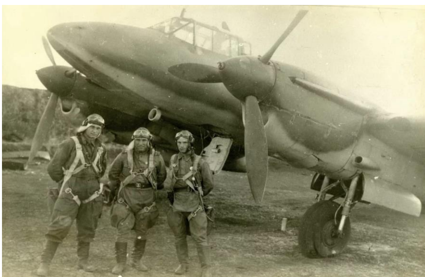
Пе-2 – пикирующий бомбардировщик и его экипаж