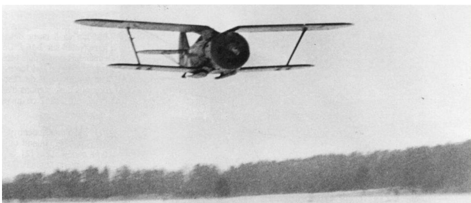
«Чайка» в полёте.