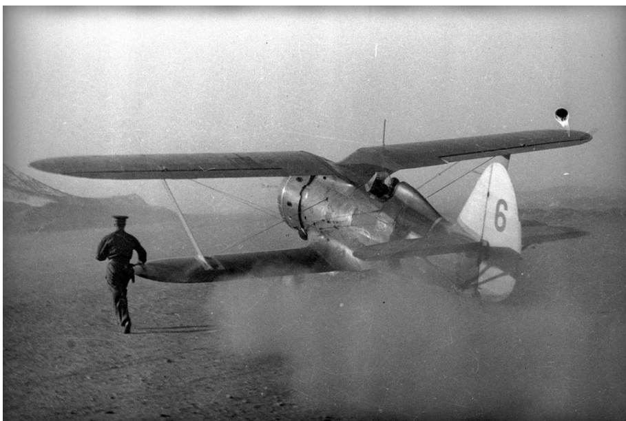
Истребитель И-153 («Чайка») выруливает для взлёта. Северный флот.