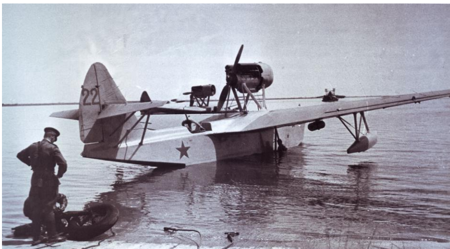
МБР-2 – морской ближний разведчик в Ейском лимане