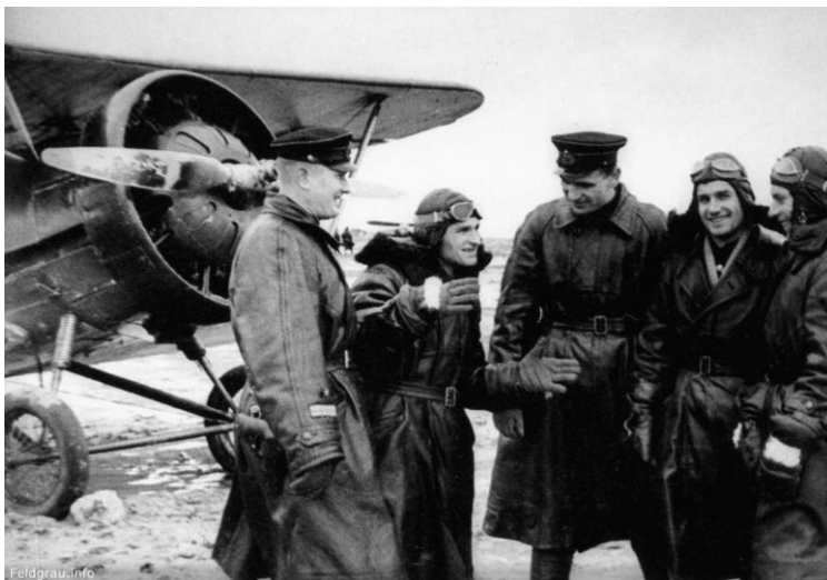
Лётчики Черноморского флота возле истребителя И-5