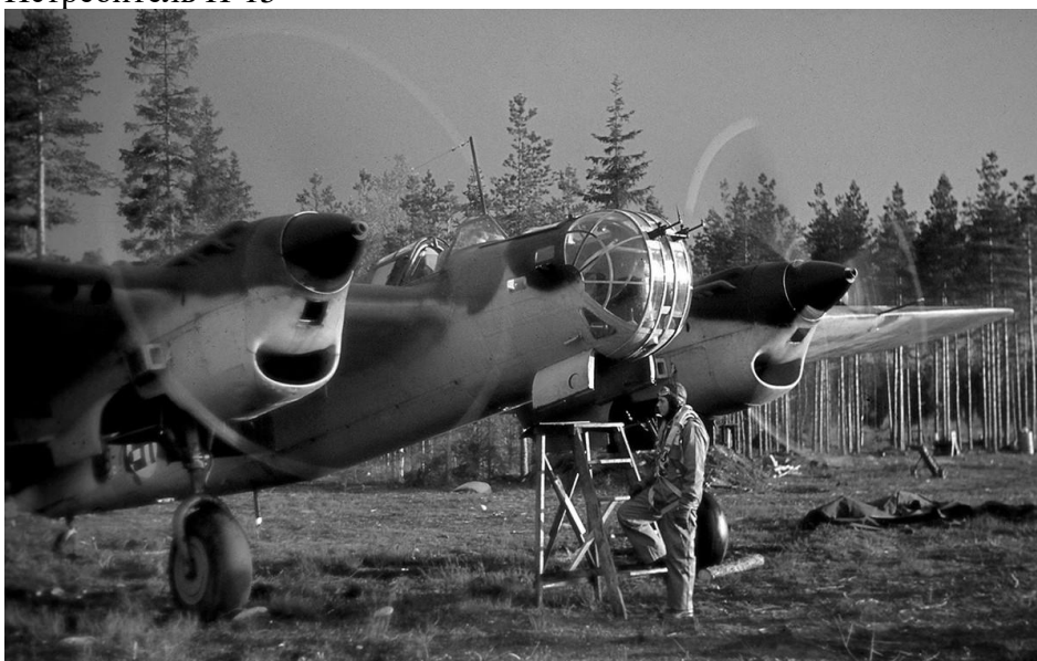
СБ – скоростной бомбардировщик