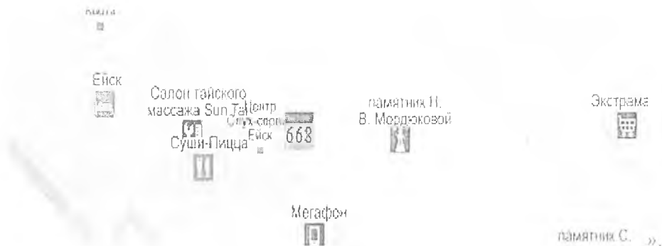
СХЕМА (графическая часть) размещения нестационарных торговых объектов

Начальник управления архитектуры и градостроительства администрации муниципального образования Ейский район