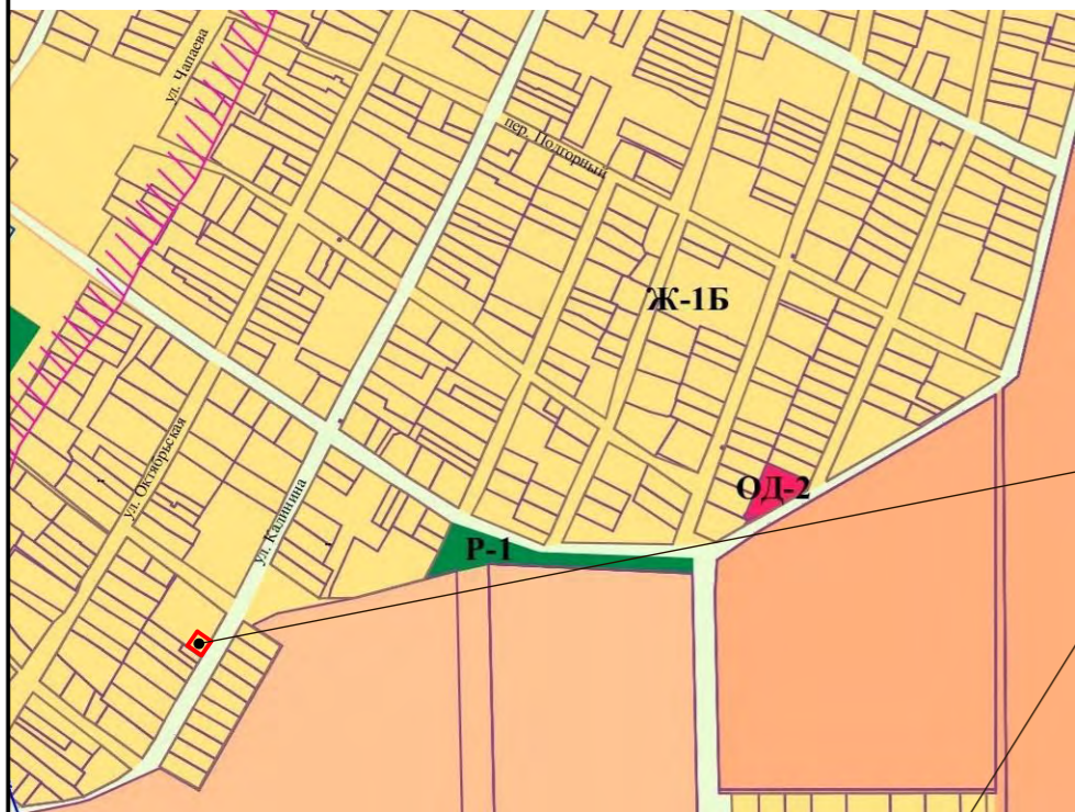
Схема градостроительного зонирования с картой зон с особыми условиями использования территории М1:2000